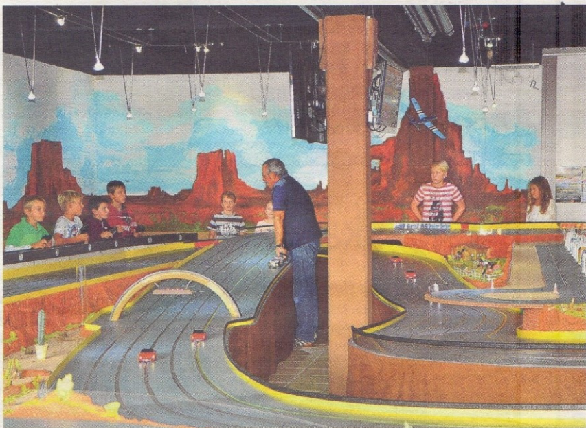
Die Slot Racing Bahn Nebikon ist rund 50 Meter lang.